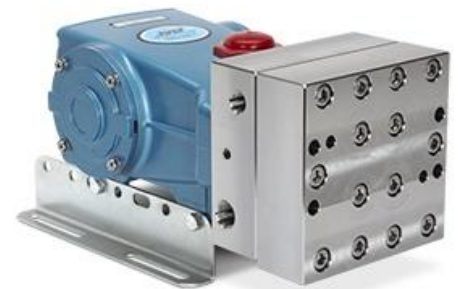
CatPumps model 781K