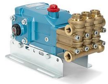
CatPump model 5CP4120CSS