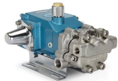
Catpomp model 3CP1241.44101