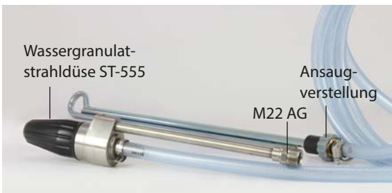
Abgestimmt: beste Wirkungsweise durch das Zusammenspiel von Luftdruck und der Luftmenge an der Strahldüse