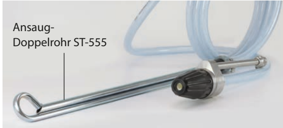
Ansaugrohr: beste Aufnahme des Strahlmittels durch Doppelrohr