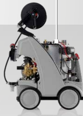
therm-C 13/180 | 628210