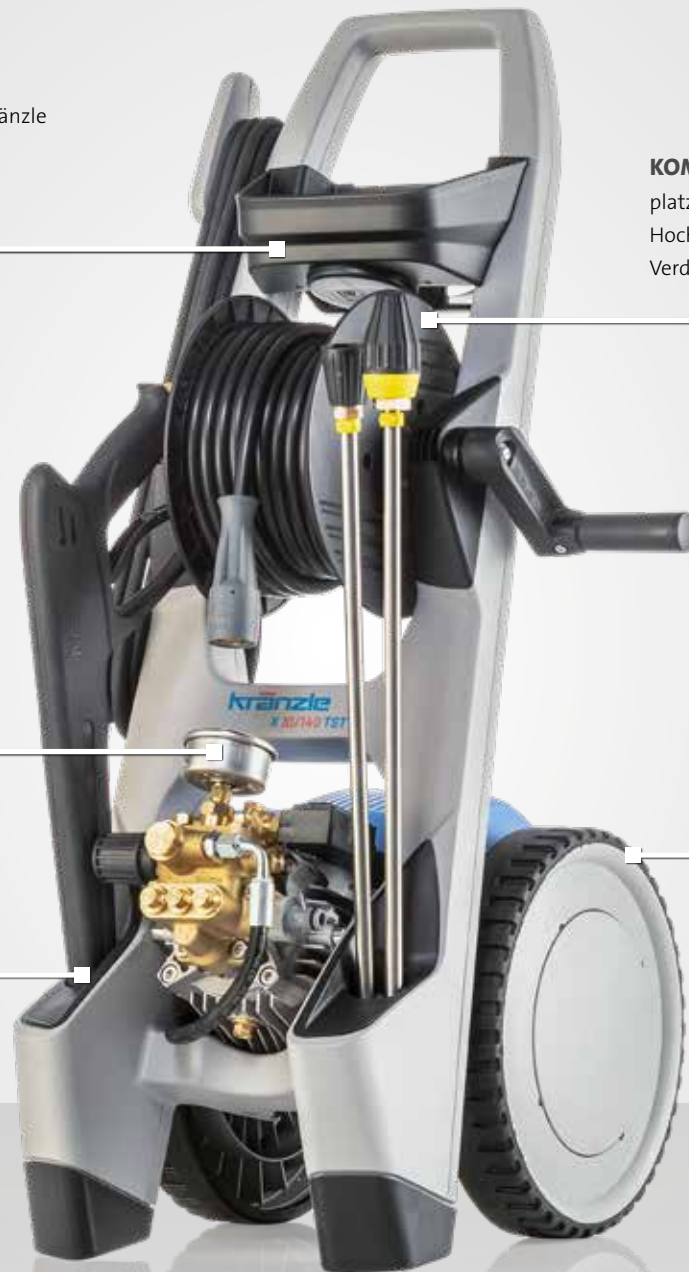
Abb.: X 10/140 TST | 603610

praktische Halterungen für Hochdruckpistole und Reinigungslanzen